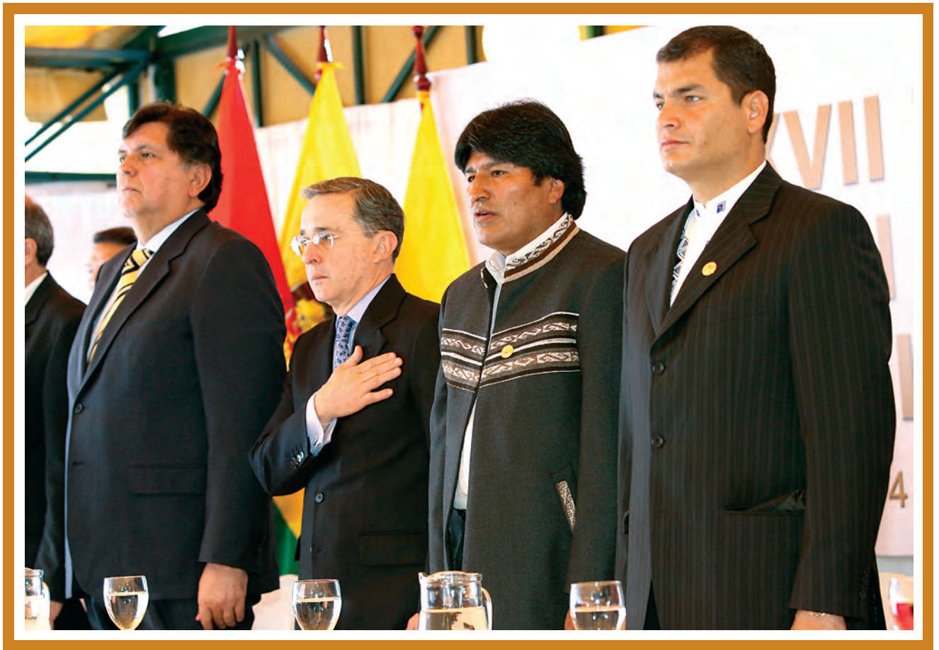
XVII Consejo Presidencial Andino, Tarija, 14 de Junio de 2007.